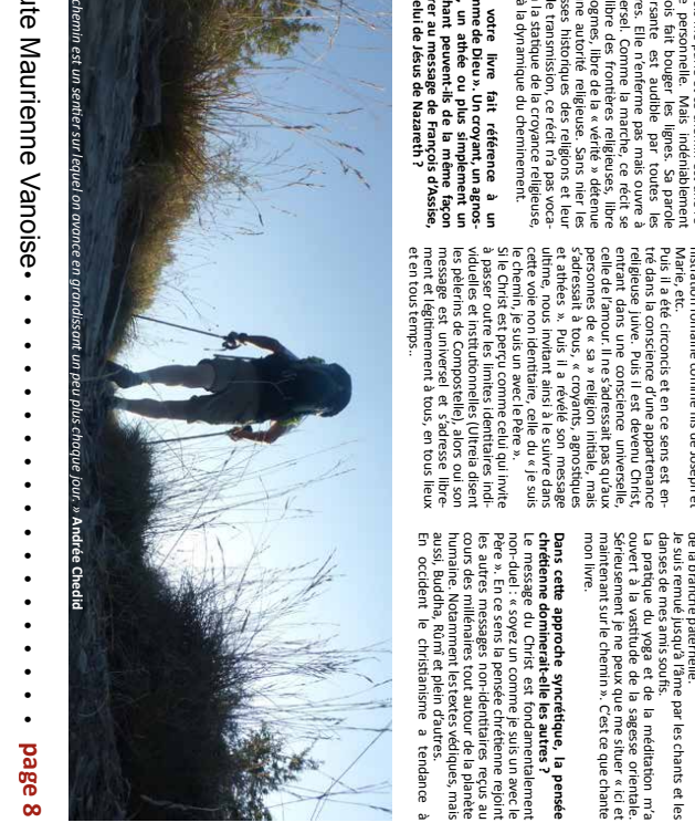
Un chemin est un sentier sur lequel on avance en grandissant, un peu plus chaque jour. » André Gide