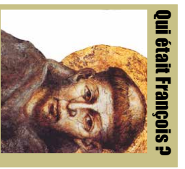
Qui était François ?