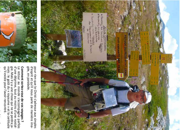
Comment se préparer à un voyage ?

Le voyage est un moment de vie, un moment de découverte. Il faut se préparer à l'avance, à la fois matériellement et spirituellement. Cela implique de faire des recherches, de préparer son itinéraire, et de se laisser aller à l'improvvisation.